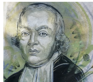
L'Abbé de l'Epée par l'artiste français C215

Dans l'église Saint-Roch, à gauche en entrant, se trouve le mémorial de l'Abbé de l'Epée (1712-1789). C'est lui qui, le premier, offrit une instruction gratuite pour les sourds et leur donnait enfin une place dans la société. S'inspirant de leur langue des signes, il leur permit non seulement d'« entendre » la Parole de Dieu, mais de se faire « entendre ». Les sourds du monde entier ont une grande reconnaissance pour lui.